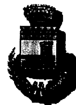
Comune di Signa