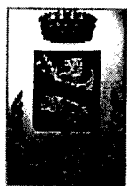
Comune di Calenzano