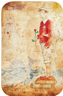
Tavola di Giampaolo Talani